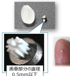
歯車部分の直径 0.5mm以下