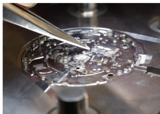
1ミクロン（1/1000mm）の加工精度