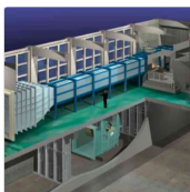
国内最大級の 大型風洞実験装置

複雑で捉えにくい風・空気や液体などの流体の動きを知り、 「ものづくり」から「まちづくり」まで 安心や安全、新しいアイデアや価値を生み出す