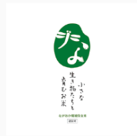
小さな生き物たちと育てるお米 ロゴ CL: 長岡市