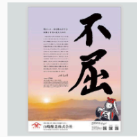
山崎醸造 新聞広告 CL: 山崎醸造株式会社