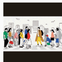
JAPEX シネアド CL: 石油資源開発株式会社 (JAPEX)