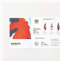
大日養鯉場 パンフレット CL: 大日養鯉場株式会社