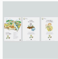
Nサイクル ポスター CL: Nサイクルプロジェクト