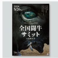
全国闘牛サミット In 長岡大会 ツール CL: 全国闘牛サミット In 長岡大会実行委員会