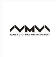
山本山産原ブルワリー ロゴ CL: 株式会社アグリたかの